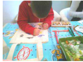
アートワークの様子